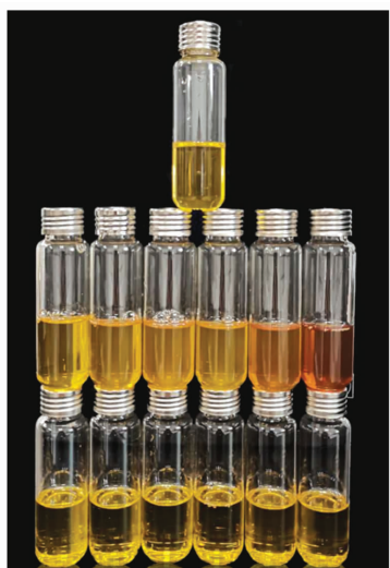
注:下层从左至右:120℃/10~30 min,140℃/10~30 min;中层从左至右:160℃/10~30 min,180℃/10~30 min;上层:对照。