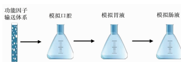
图 2 功能因子运输体系体外消化实验过程 [46] Fig.2 Functional factor transport system in vitro digestion experimental procedure [46]