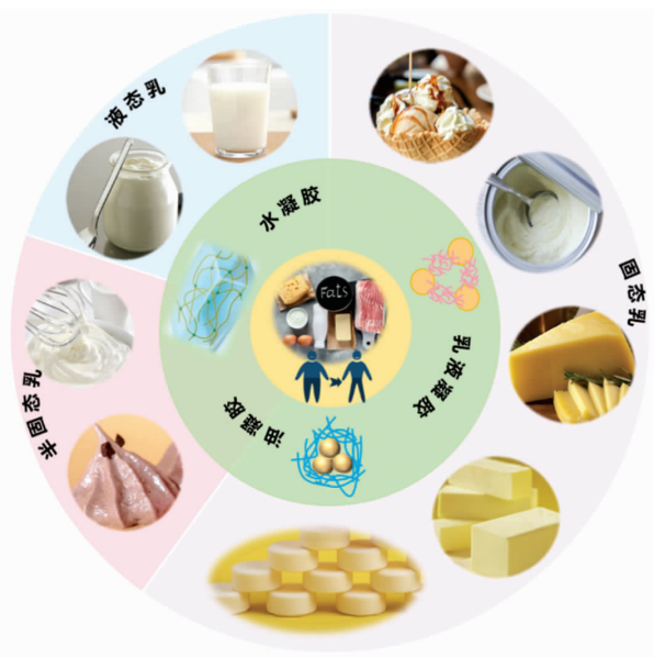
图 3 脂肪替代物在乳制品中的应用

根据国际乳业联合会(IDF)的定义,液体乳包括巴氏杀菌乳、灭菌乳和酸乳 3 类。由于减少脂肪会导致酸奶微观结构孔隙变大、黏度和硬度降低,并出现乳清析出等问题,因此研究脂肪替代物在酸奶中的应用愈来愈多 [46-50] 。在低脂酸奶生产的过程中,不同的原料脂肪替代物通常具有不同的脂肪替代功能。阴离子多糖如果胶、羟甲基纤维素等作为脂肪模拟物可以减少乳清析出和稳定酪蛋白胶束,因为在适宜 pH 值下,它们通过静电相互作用吸附在带阳离子的酪蛋白胶束表面,通过改变空间位阻和增强分子间空间斥力,从而防止酪蛋白胶束发生聚集 [51-52] 。同时果胶还可以使凝胶网络截留住更多水分。中性多糖主要通过增加连续相